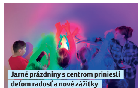
Jarné prázdniny s centrom priniesli deťom radosť a nové zážitky strana 8