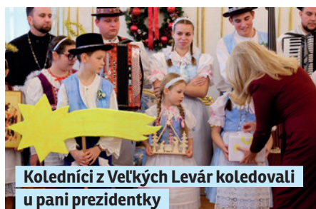
Koledníci z Veľkých Levár koledovali u pani prezidentky strana 6