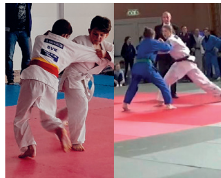
Fotografie – Archiv rodiny Binčíkovci